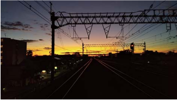
肉眼ではもっとキレイだったよ！